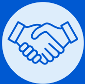
Table Opportunités d'Affaires :