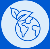
Table Environnement :