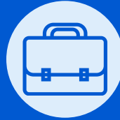
Table Emploi et Formation :